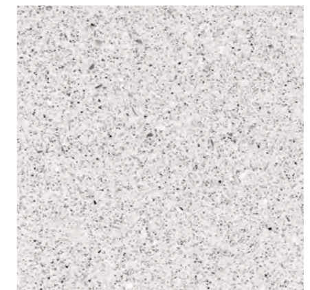
MOSAIC WHITE SRSPMSIC60X60MAT100